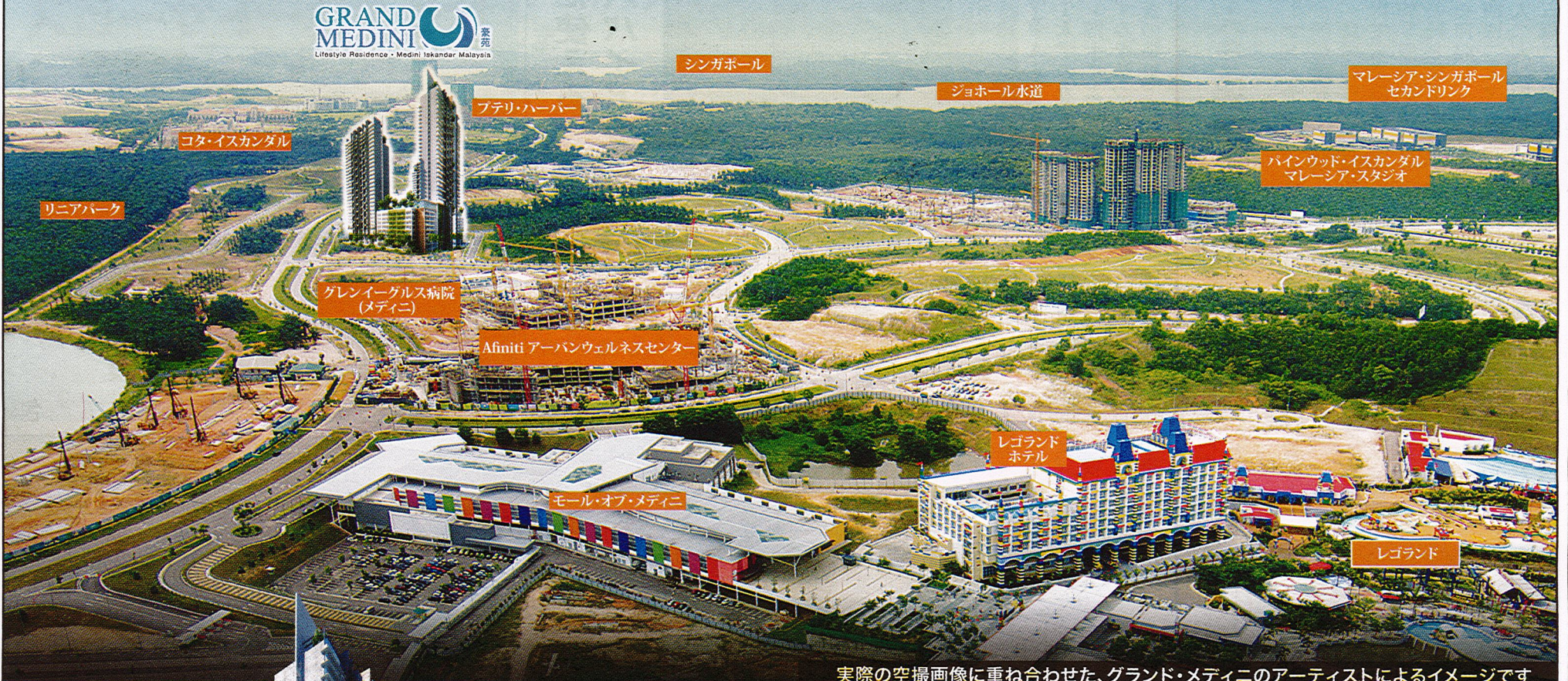
実際の空撮画像に重ね合わせた、グランド・メディニのアーティストによるイメージです